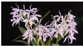
個別審査部門 奨励賞 C.maxima fma.coerulea 'Viva Guayaquil' BM/JGP カトレア マキシマ、セルレア 'ビバ グアヤキル'