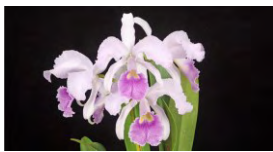
個別審査部門 トロフィー賞 C.Lowre-Mossiae 'Modern Classic' BM/JGP カトレア ローレモッシェ 'モダンクラシック'