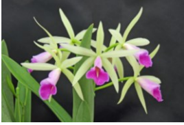
Brassocattleya Miracle Star 'Smart Green' SBM 78p ブランチカトレア ミラクルスター 'スマートグリーン' SBM