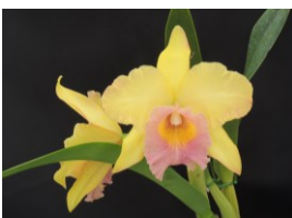
Rhyncholaeliocattleya Fresh Yellow 'Fruit Cocktail' BM 76p リンコレリアカトレア フレッシュイエロー 'フルーツカクテル' BM