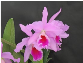
Cattleya Mystery Zone 'New Taste' SBM 79p カトレア ミステリーゾーン 'ニューテイスト' SBM