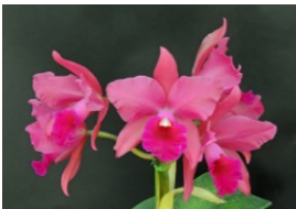
Cattlianthe Silky Red 'Satin Doll' BM 77p カトリアンセ シルキーレッド 'サテンドール' BM