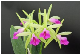
Brassocattleya Miracle Star 'Lime Cherry' SBM 78p ブランチカトレア ミラクルスター 'ライムチェリー' SBM