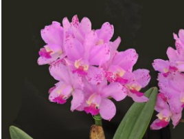
Cattleya Loddiglossa 'Miel Rosa' SSM 85p カトレア ロディグロッサ 'ミエルローザ' SSM