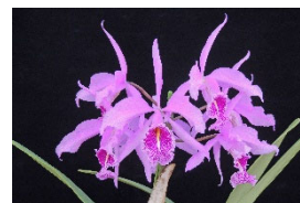
C. maxima 'Amigo' BM 77p カトレア マキシマ 'アミーゴ' BM