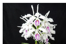
C. maxima fma.semialba 'Emissary' SM 81p カトレア マキシマ、セミアルバ 'エミッサリー' SM