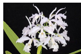
C. maxima fma.coerulea 'Enamor' SBM 78p カトレア マキシマ、セルレア 'エナモール' SBM