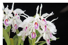
C. maxima fma.semialba 'Ramo de Flores' SM 83p カトレア マキシマ、セミアルバ 'ラモ・デ・フローレス' SM