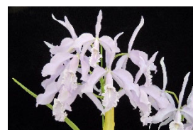
C. maxima fma.coerulea 'Silent Blue' SSM 86p カトレア マキシマ、セルレア 'サイレントブルー' SSM