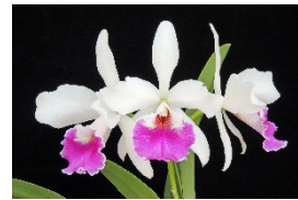
Bc. Sanyo Compton 'Lucky Girl' SM 81p ブラソカトレア サンヨーコンプトン 'ラッキーガール' SM