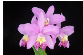
C. Max Pink Ball 'Future Pink' BM 77p カトレア マックスピンクボール 'フューチャーピンク' BM